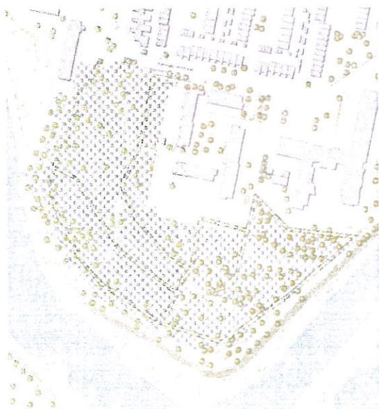
Locatie overzicht; werkzaamheden worden uitgevoerd in het geblokte gebied

In mei 2018 hebben we u per brief geïnformeerd over het vervangen van het drainagesysteem in het park ten zuiden van Woon- en Zorgcentrum De Merwelanden (deelgebied 1-onbebouwd). In deze brief leest u meer over de start van deze werkzaamheden.